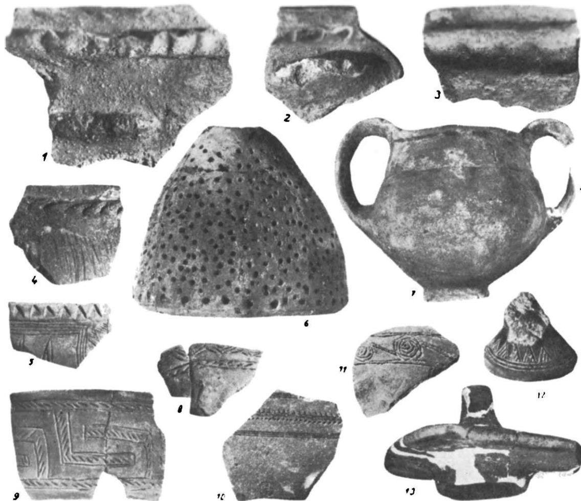
Fig. 1. Vlădești. Fragmente ceramice: 6, o strecurătoare; 7, o cană; 13, un capac. Cultura Verbicioara.

Materialul arheologic descoperit cuprinde, în principal, fragmente ceramice și numai în cazuri rare, vase întregi sau întregibile. Din punct de vedere tehnic, ceramica din această așezare nu se deosebește în general de produsele cunoscute