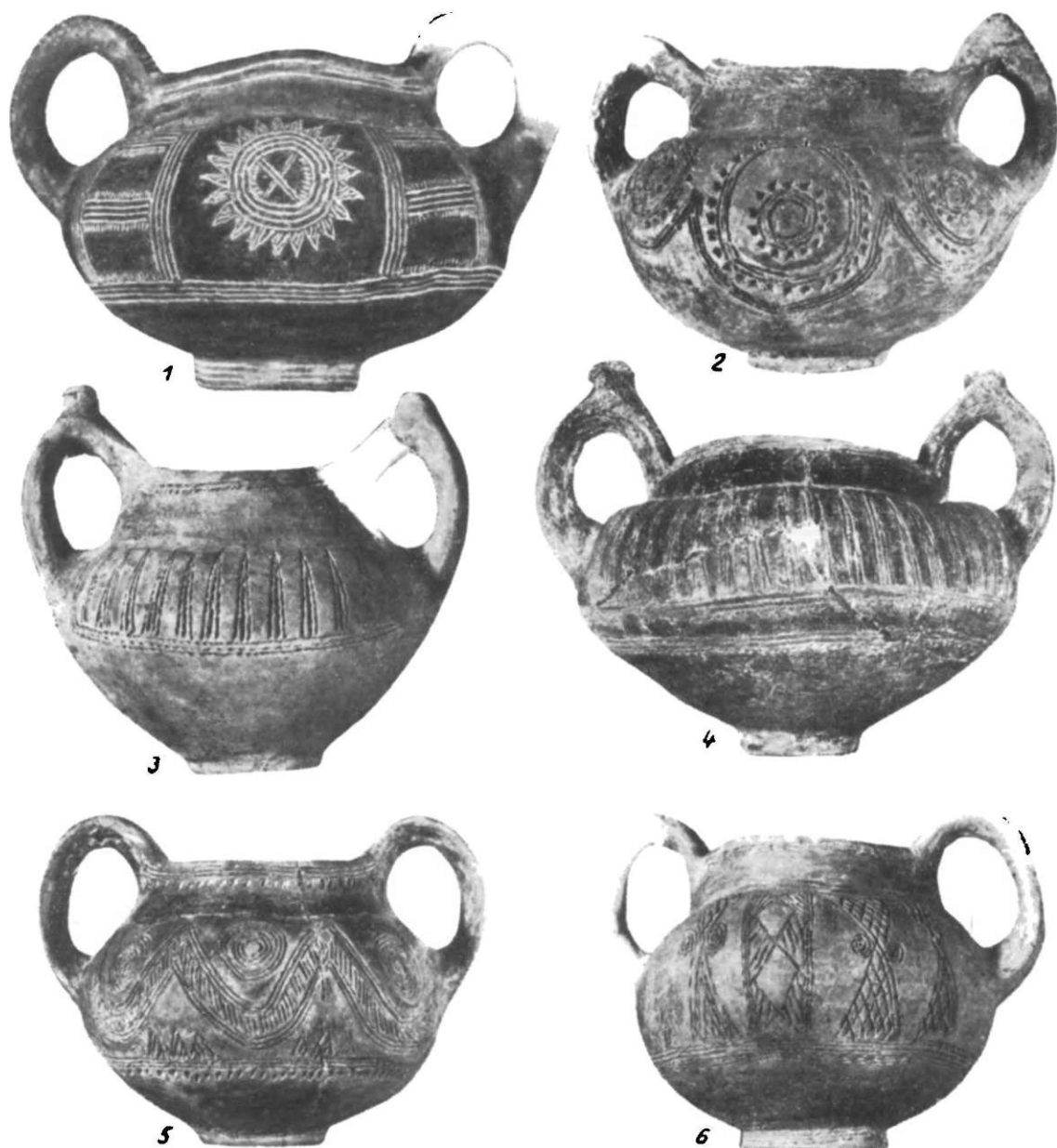
Fig. 3. — Vase întregi din «depozitul» de la Govora-sat, r. R. Vilcea. Cultura Verbicioara.

Triunghiurile isoscele sînt înalte, răspunzînd preocupării permanente de a se da ornamentării un caracter tectonic cît mai pronunțat (fig. 3/3--4). O combinație de motive ornamentale ne-o oferă vasul de la fig. 3/6, unde benzile de linii incizate se combină cu romburi, triunghiuri hașurate și capete de spirale.